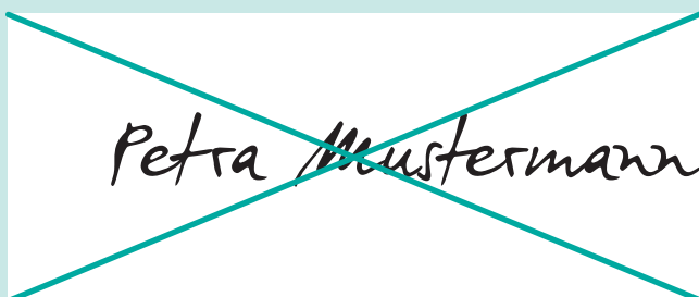
Falsch: Unterschrift rechtsbündig