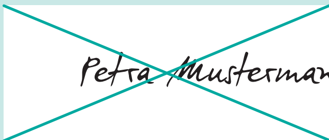
Falsch: Unterschrift nicht innerhalb des Feldes